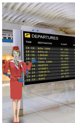
キャビンアテンダント