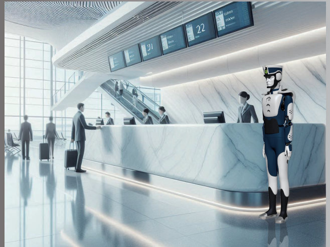
空港 チェックインカウンター