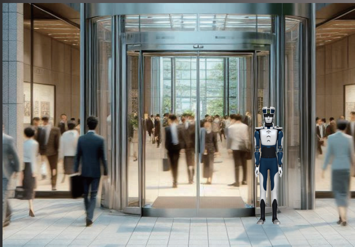
オフィスビルエントランス